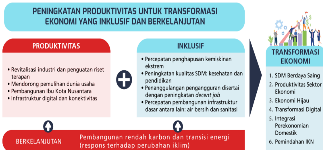
Gambar 3.1. Kerangka Pikir Tema RKP Tahun 2023

“Peningkatan Produktivitas untuk Transformasi Ekonomi yang Inklusif dan Berkelanjutan.”